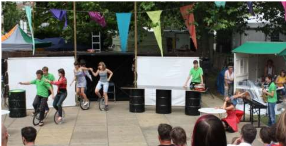
WOK op de Gentse Feesten (juli 2009)