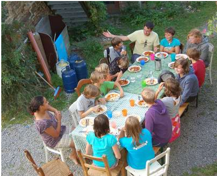
Zig Zag op productiestage in Clerheid (augustus 2009)

Zig Zag is een jonge groep en had dit jaar vooral veel nood aan begeleiding en artistieke input. Dit jaar concentreerden we ons op creatieproces van de groep. In 2010 worden de detail uitgewerkt, decor en kostuums, en gaan we de baan op !