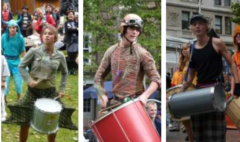
Dynamo in New York (september 2009)

Een greep uit de optredens (volledige lijst in bijlage)