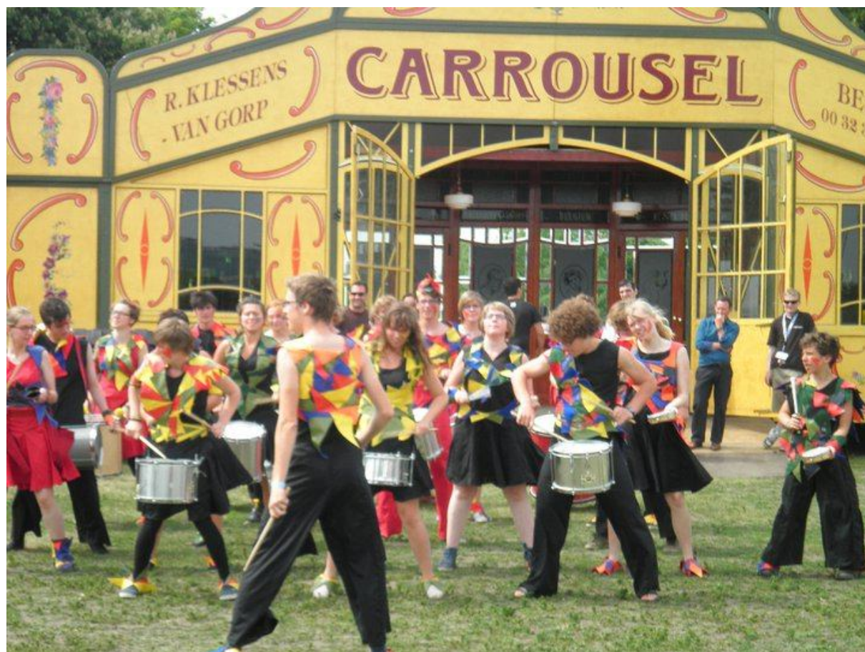
DYNAMO in Londen, mei 2011

(*) De festivals in Hannover en Tallinn kaderen in het Europees project "What makes us move".