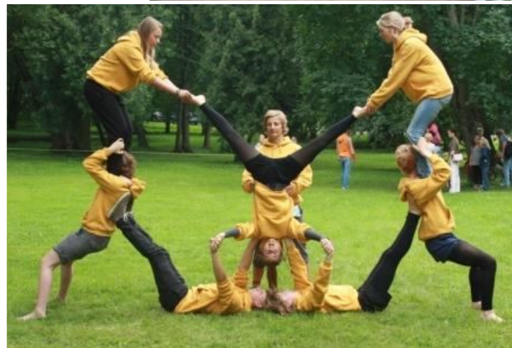
Augustus 2011, WOK en Dynamo in Tallinn, Estland