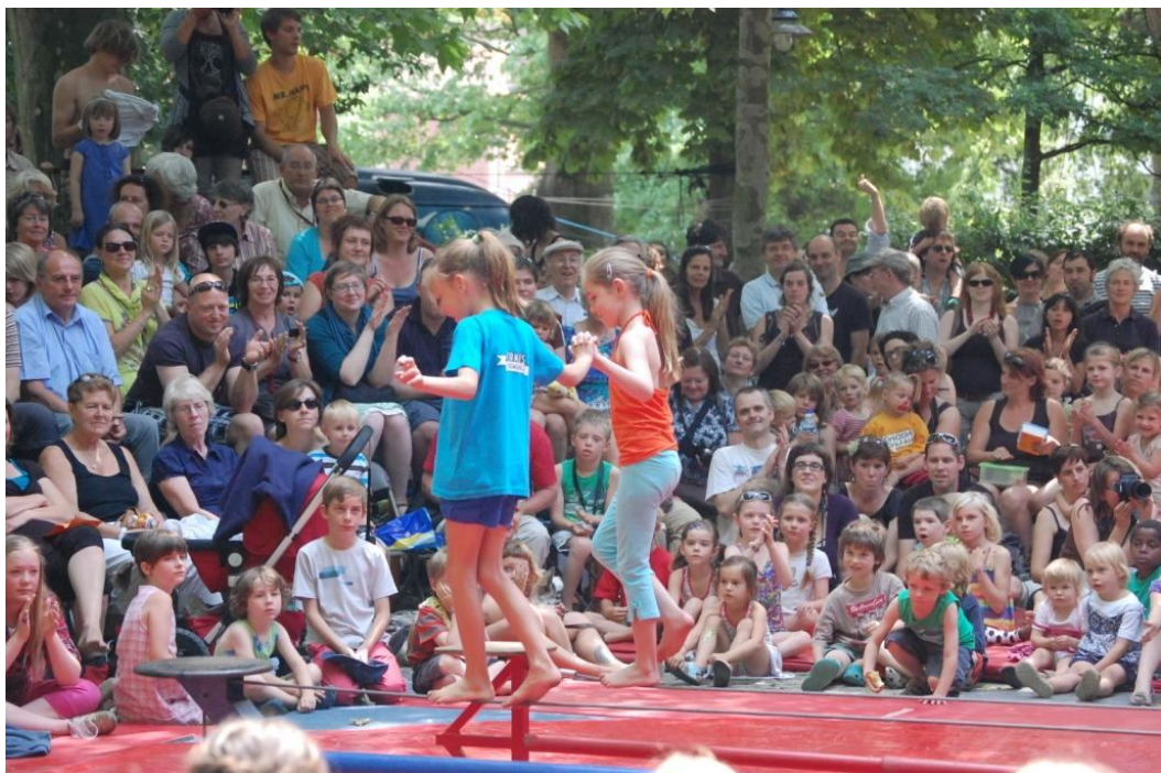
Toonmoment op "Circus & Co", Leuven, 3-4 juni 2011

Verder heeft het Circuscentrum ons de vraag gesteld om in het kader van het opzetten van een circushumaniora in andere steden, een voorbereidend leerplan te schrijven met competentieprofielen.