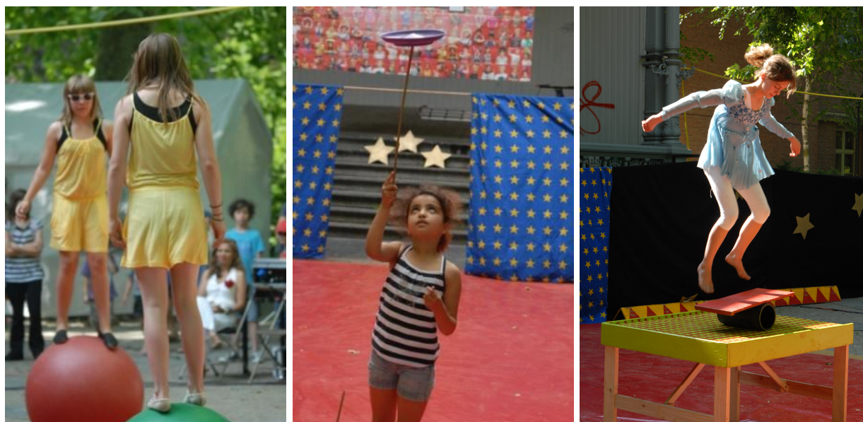
Toonmomenten op "Circus & Co", Leuven, 3-4 juni 2011