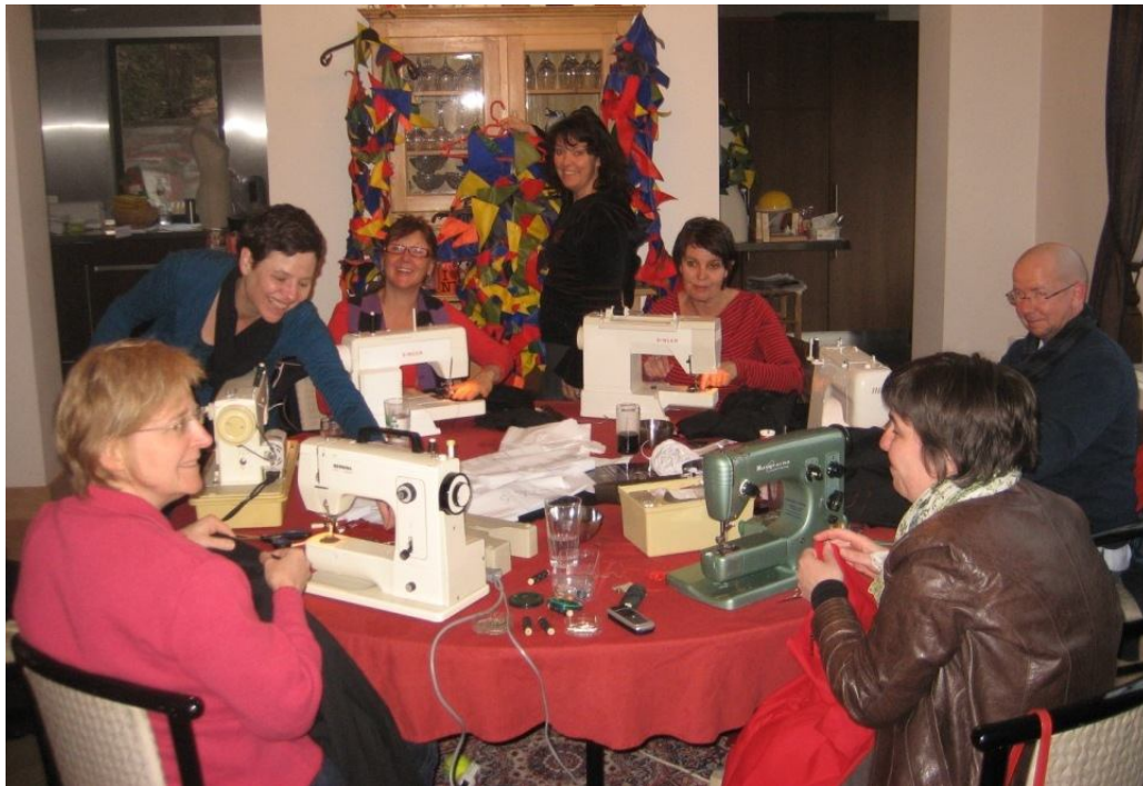
Enkele van de Madammen, die in 2011 veel en hard gewerkt hebben aan de nieuwe kostuums van Dynamo.