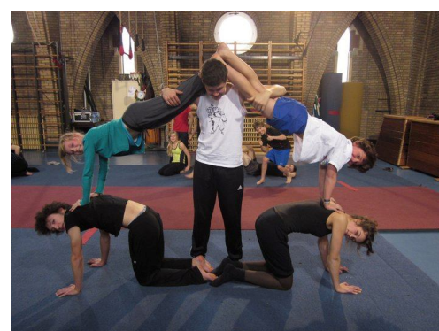
Acrostage voor gevorderden tijdens de paasvakantie