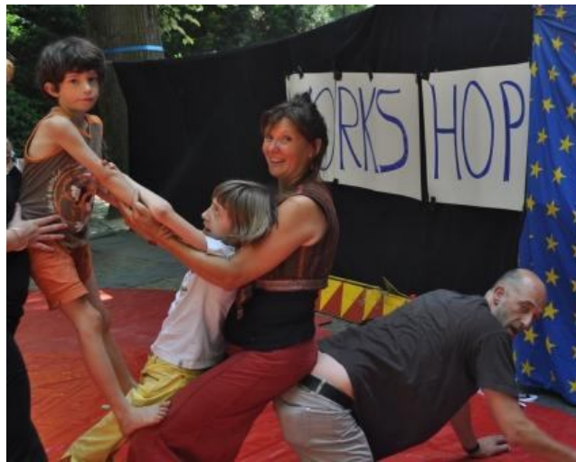
Circus & Co, 4 juni 2011, workshop voor gezinnen met een kind in Windekind

We hebben over heel Vlaanderen een expertise opgebouwd door workshops te verzorgen voor mensen met een beperking. Een aantal docenten van het vaste team heeft zich hierin verdiept en wil dit graag verder zetten in Leuven op meer structurele wijze.